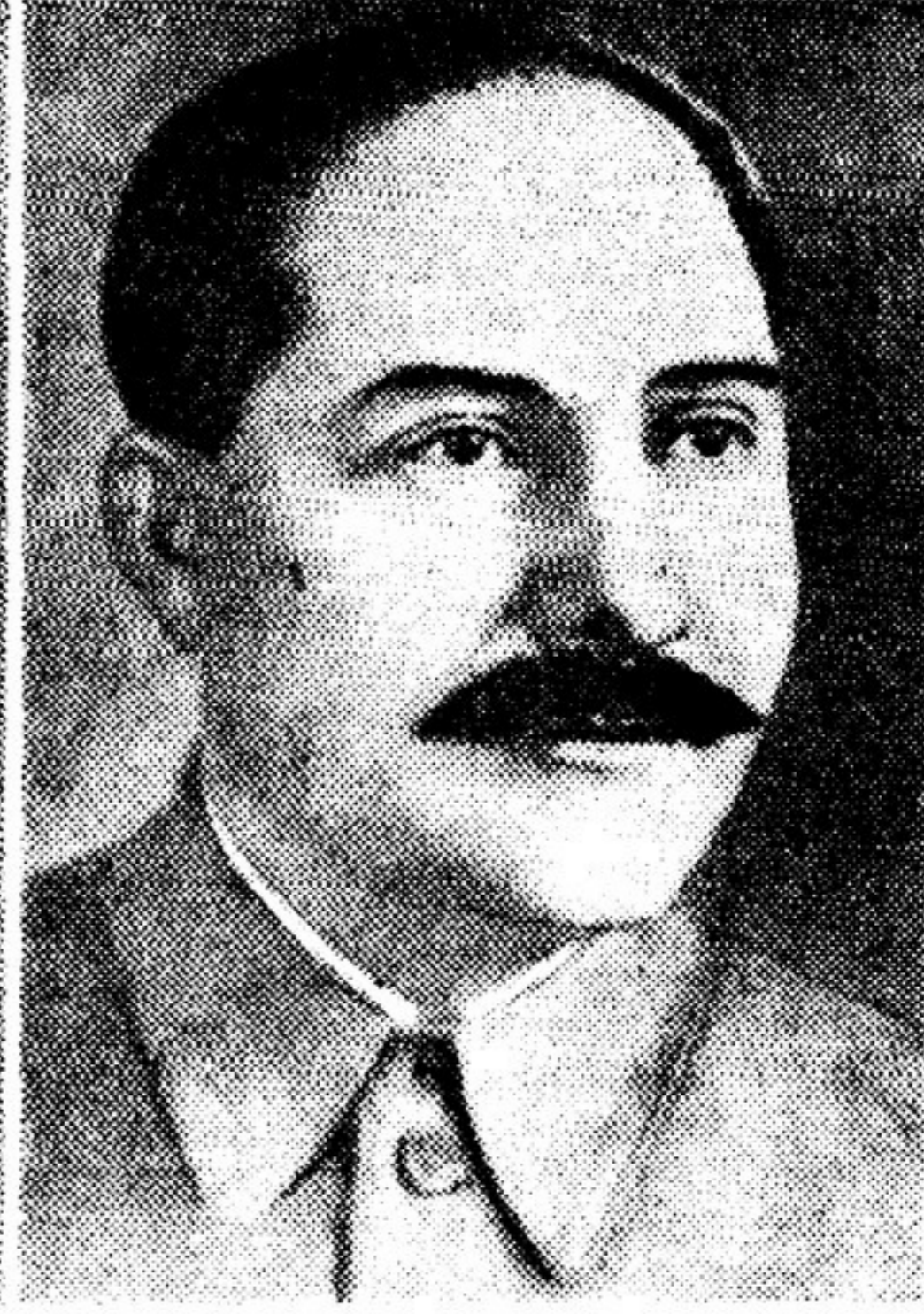
Л. М. Каганович