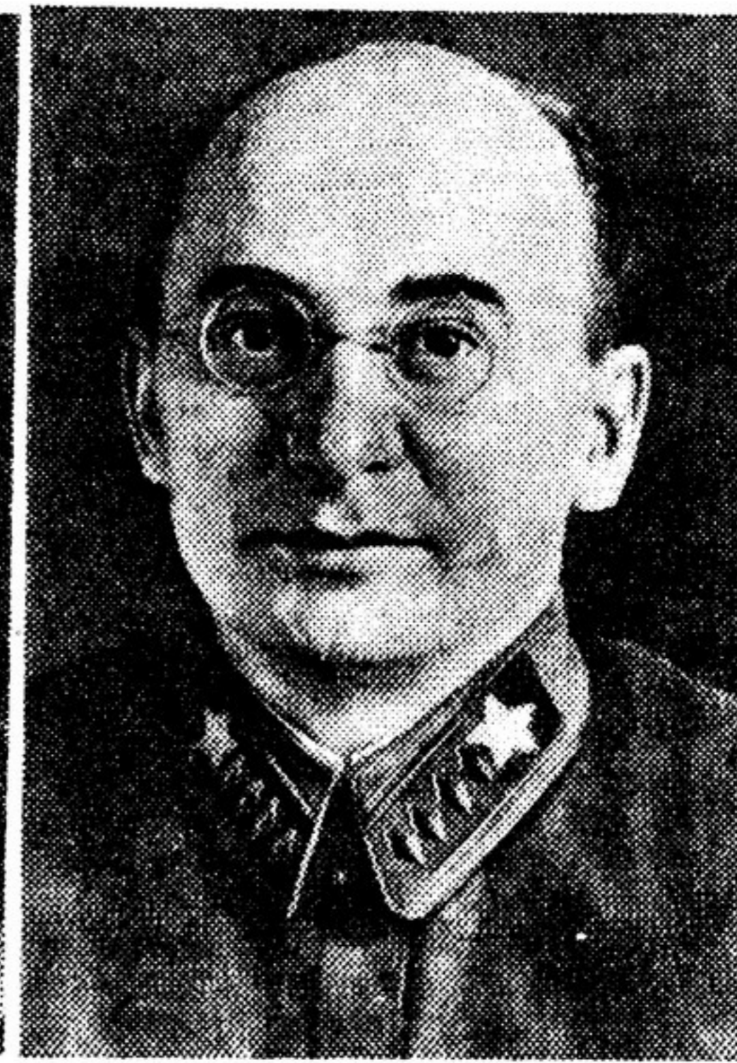
Л. П. Берия