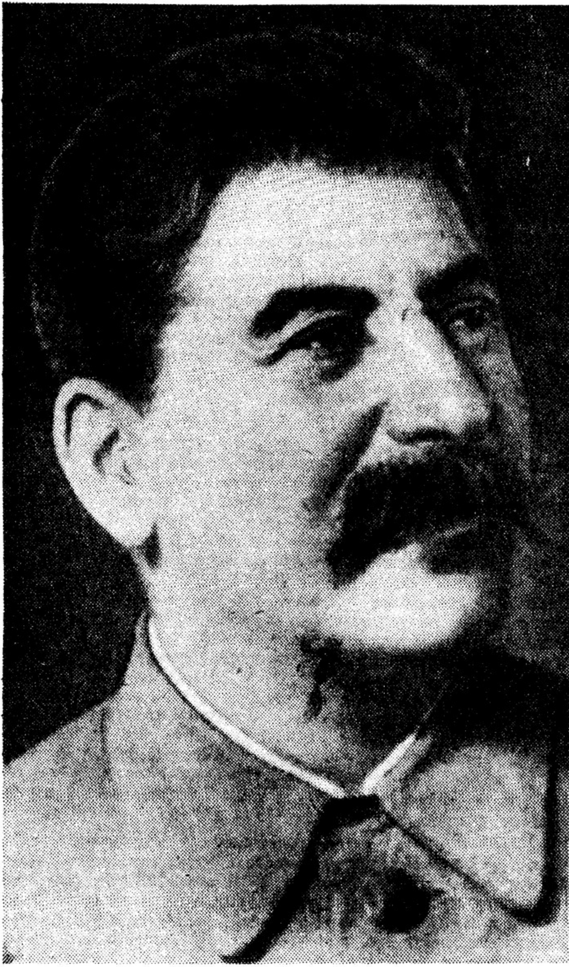
И. В. Сталин