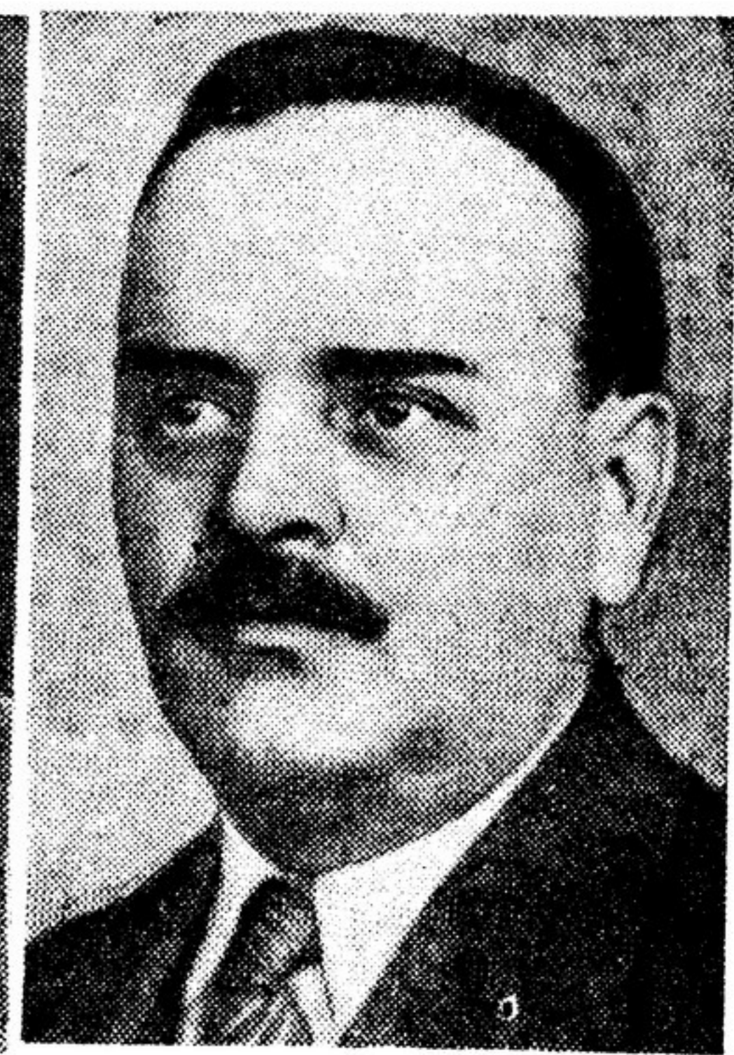
Н. М. Шверник