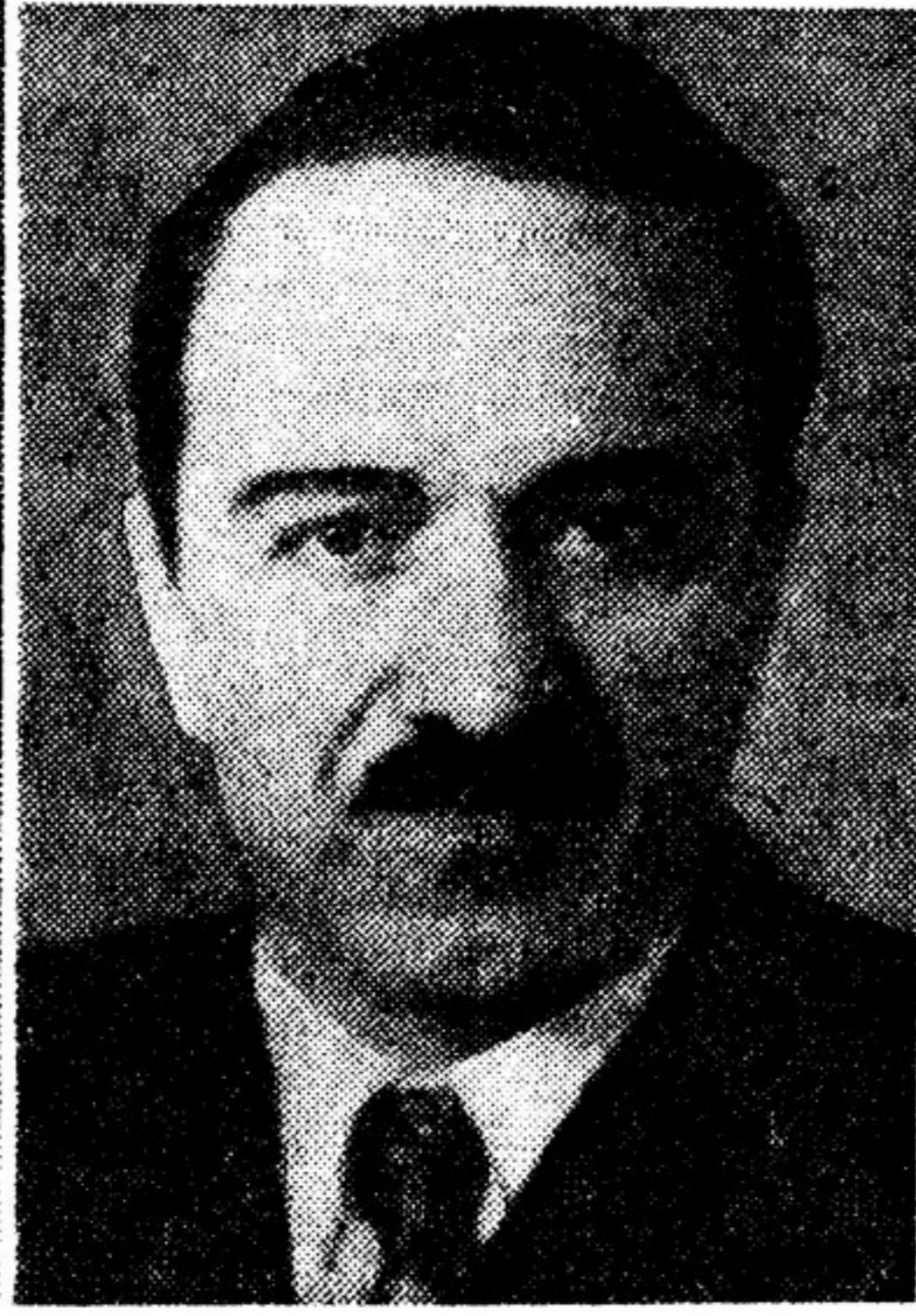
А. И. Микоян