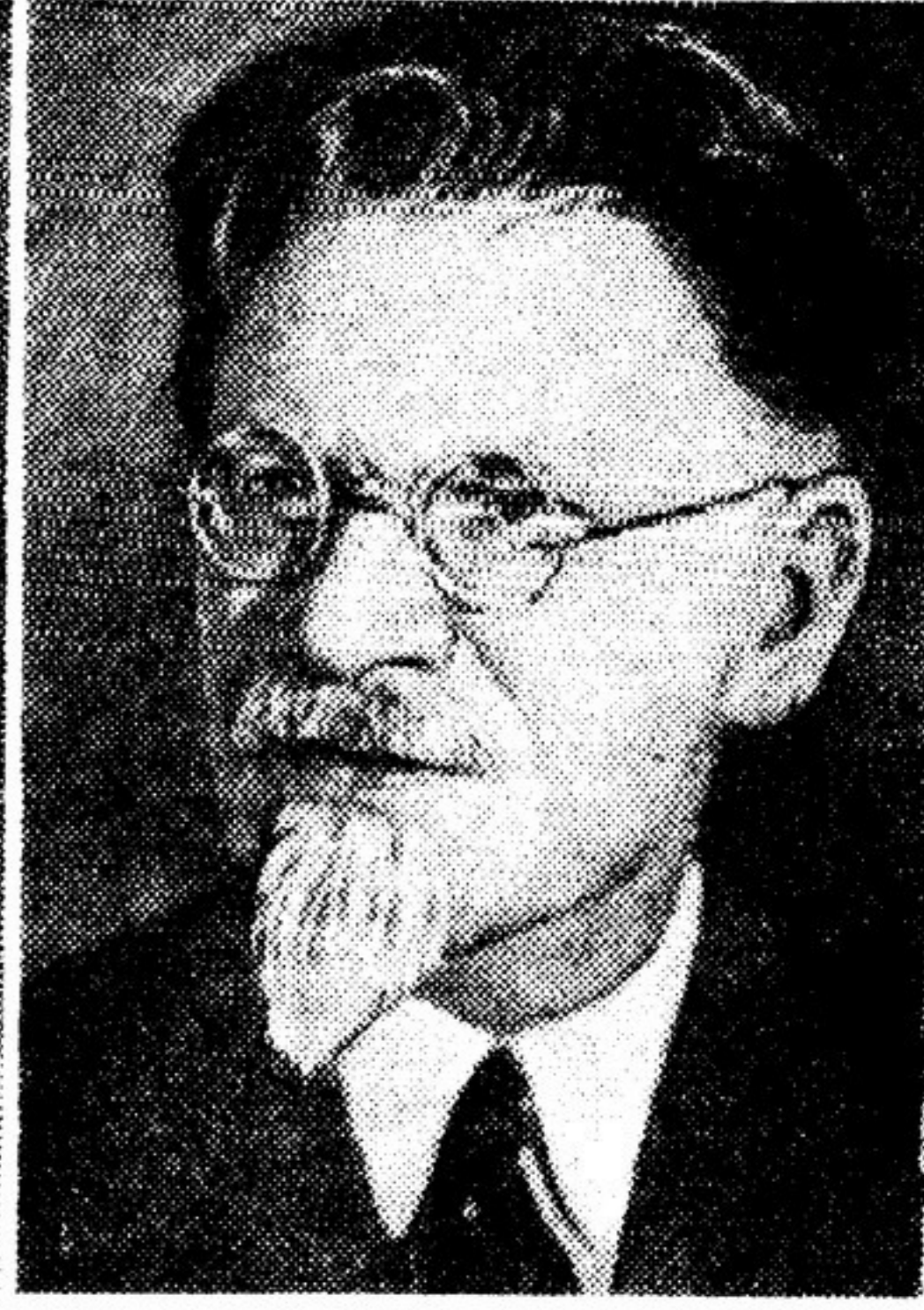
М. И. Калинин