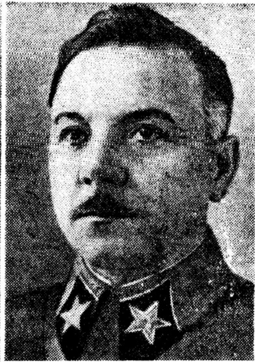
К. Е. Ворошилов